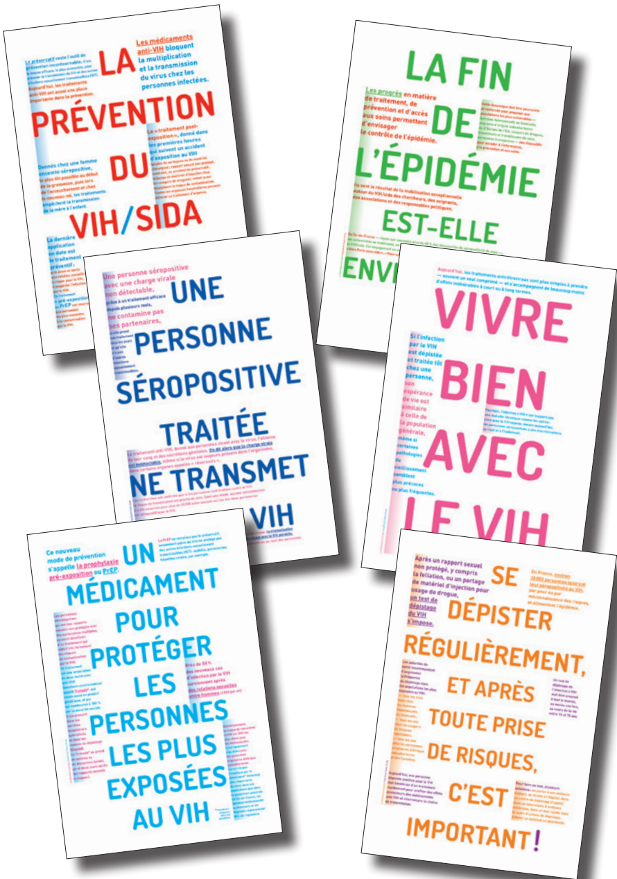
« LA PRÉVENTION DU VIH/SIDA », une exposition proposée par le Crips Île-de-France et vih.org Pour en savoir plus : documentation@lecrips.net • tél. : 01 56 80 33 10